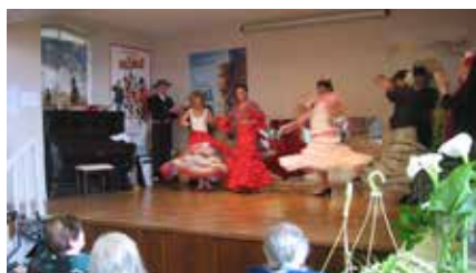
Les danses espagnoles ont contribué à la belle ambiance de la journée

Pour fêter les 70 ans du Secours Catholique, l'équipe de Biarritz a souhaité partager la journée du 18 mai avec les personnes âgées de la maison de retraite « Notre Maison » de Biarritz. Un groupe de danse espagnole a eu la gentillesse de venir danser pour le plus grand plaisir de tous les pensionnaires. Leur joie et leurs applaudissements ont réchauffé nos cœurs. Nous avons partagé un goûter et ce fût un merveilleux moment de convivialité !