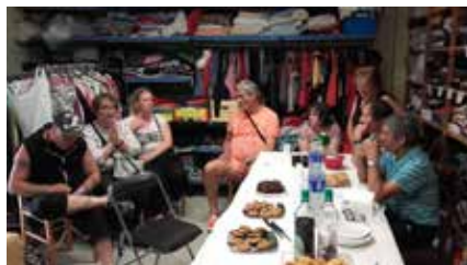
Rencontre de l'équipe «Ça se passe en ville» avec des bénévoles du Secours Catholique à Orthez, autour du goûter le 3 août dernier