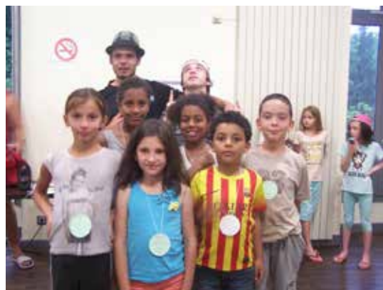
Veillée récompense olympique et soirée musicale lors du camp

« Camp savez-vous ?! » ou le camp des jeunes à Mauléon avec le Secours Catholique des Pays de l'Adour