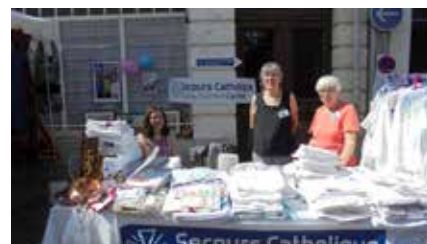
La braderie d'Hendaye : un beau moment pour faire connaître l'équipe et garder des liens avec les personnes rencontrées pendant l'année

Traditionnellement, la braderie du centre-ville d'Hendaye réunit bon nombre d'acteurs de la ville touristique. Cette année, c'est le jeudi 11 août qu'a eu lieu cette manifestation à laquelle l'équipe du Secours Catholique d'Hendaye s'est associée. Un moment idéal pour partager avec les habitants et les touristes, cette journée a été une belle occasion de faire découvrir les activités de l'équipe et la boutique solidaire à quelques rues du stand ! Les bénévoles ont pu échanger avec les habitants, les