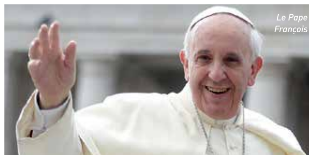
Le Pape François