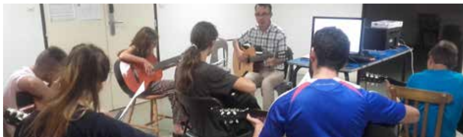
Cours de guitare pendant le camp musique