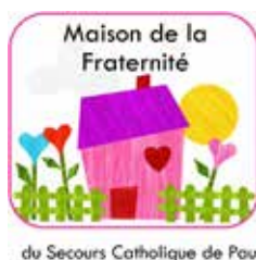
Logo de la Maison de la Fraternité de Pau

Après quelques travaux de mise aux normes, l'achat de mobiliers et accessoires, un nouveau lieu d'accueil situé au 4 rue Pierre et Marie Curie à Pau, verra le jour prochainement. Une maison ouverte à tous, lorsque les autres lieux d'accueil sont souvent fermés : fin d'après-midi et week-end à l'heure où solitude et isolement sont particulièrement pesants. Nous recherchons activement des bénévoles et commençons à communiquer auprès des partenaires pour que, tous ensemble, avec les talents de chacun, la mise en route de ce nouveau projet puisse s'engager. A bientôt !