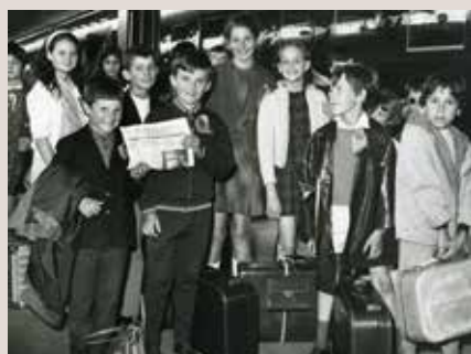
1 er envoi d'enfants en vacances organisé par le Secours Catholique

Messages de novembre 1948 raconte : « Mille-huit-cents-cinquante-six enfants partis amaigris, les joues creuses, les nerfs fatigués, sont revenus florissants de santé, joyeux et gais comme des pinsons ». Faute de trouver des familles qui, en France, pouvaient accueillir ces enfants,