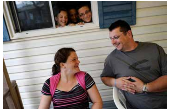
Les vacances en famille avec le Secours Catholique

Pause bien méritée ou repos salubre après une année d'engagement et d'agitation, chacun attend avec impatience les vacances pour enfin se laisser aller en s'accordant le temps de s'évader, d'échapper aux tracas quotidiens.