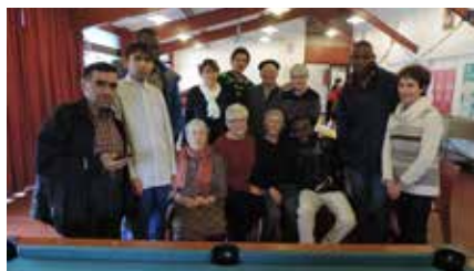
C'est l'amitié qui habite maintenant les relations entre les bénévoles et les migrants

Comment oublier ce partage entre cette quarantaine de jeunes hommes, balancés sans langage, sans argent, sans rien, dans notre village ? Le partage a été bien riche. Les hommes nous ont donné leur confiance, leur affection, leur gentillesse... Nous avons été payés au centuple de notre participation à les ai-