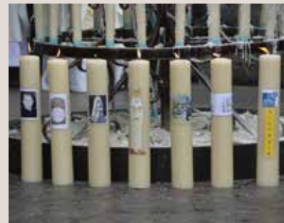
les 7 bougies décennales du Secours Catholique lors de la messe du 8 septembre dernier à la grotte de Lourdes

Le jeudi 8 septembre 1946, il y a 70 ans, le Secours Catholique voyait le jour à Lourdes !