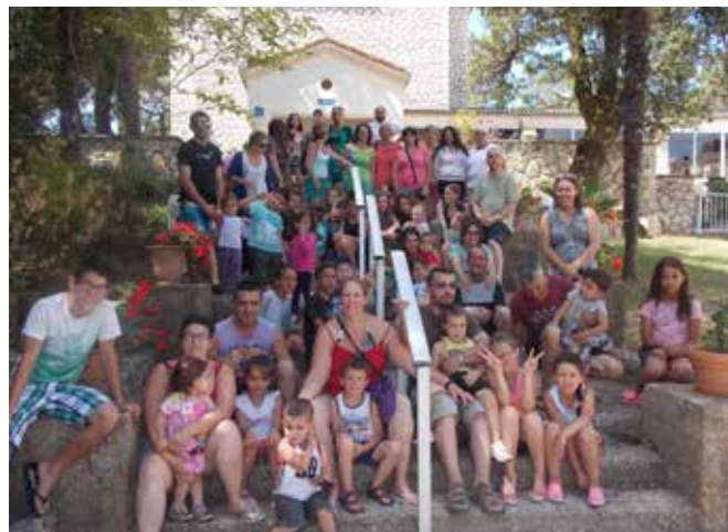
Les familles en vacances à Saint-Georges-de-Didonne

Lors du bilan, les familles ont évoqué les souvenirs qu'elles garderont de ces vacances : « Le sourire de mes enfants qui ont beaucoup rigolé ! », « En sortant du bus, quand on a vu l'océan, je me suis sentie comme une enfant, on "s'arrosait" avec