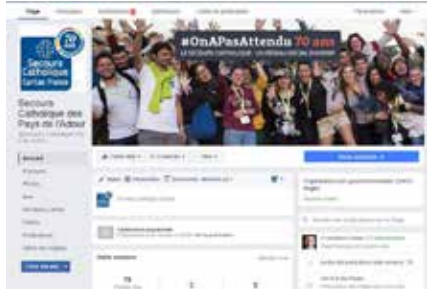
La page Facebook de la délégation du Secours Catholique-Pays de l'Adour

Cela faisait presque un an que la réflexion de la création et de l'animation d'une page Facebook était portée par l'équipe communication. Nous avons saisi l'occasion de la date anniversaire du Secours Catholique pour nous lancer ! Le 8 septembre dernier a donc été le jour de la naissance de la page Facebook «Secours Catholique des Pays de l'Adour». Aujourd'hui, 40 délégations ont une présence sur les réseaux sociaux (le plus souvent Facebook). Pour information, en 2016, Facebook compte 31 millions d'utilisateurs actifs français.